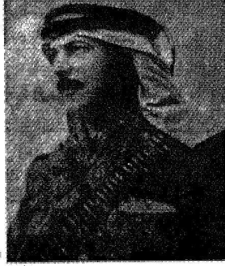
الشهيد القائد عبد القادر الحسيني

فقد كان يعمل كجهاز لنشر الدعاية للثورة .